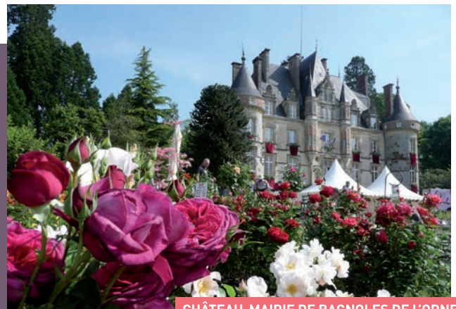
CHÂTEAU-MAIRIE DE BAGNOLES DE L'ORNE

Association Entre Ville et Jardin avec le soutien la Ville de Bagnoles de l'Orne et du Conseil général de l'Orne - Office de Tourisme de Bagnoles de l'Orne / T. 02 33 37 85 66 / www.bagnolesdelorne.com